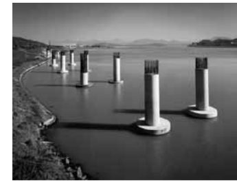
Hongsun PARK 박·혼스