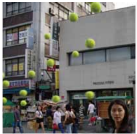
Don HA ハ・ドオン