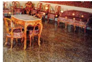
TackOon NAM 남·텍운