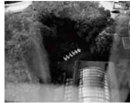
Emi FUKUYAMA 福山 えみ